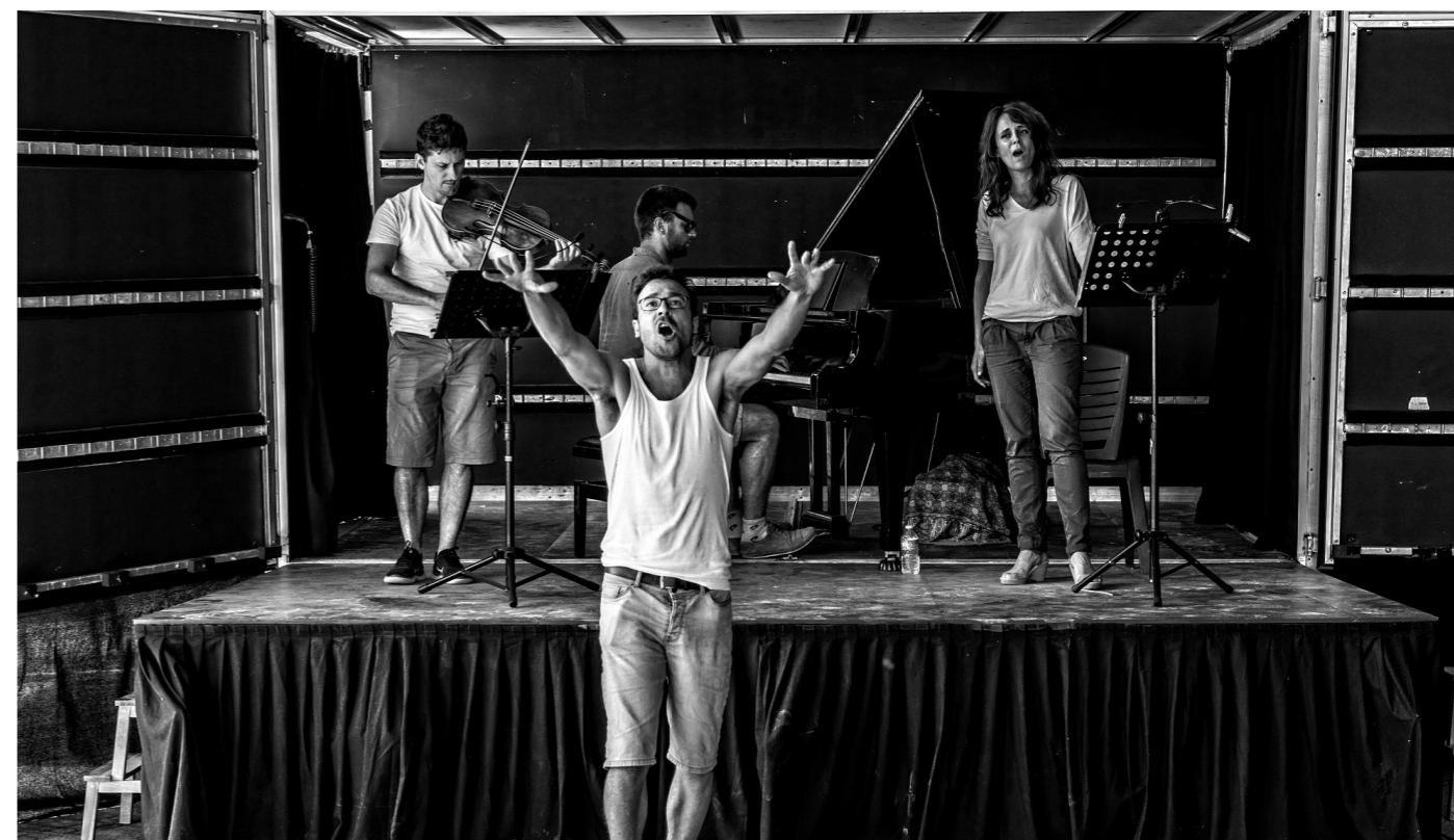
Les répétitions de Silence !