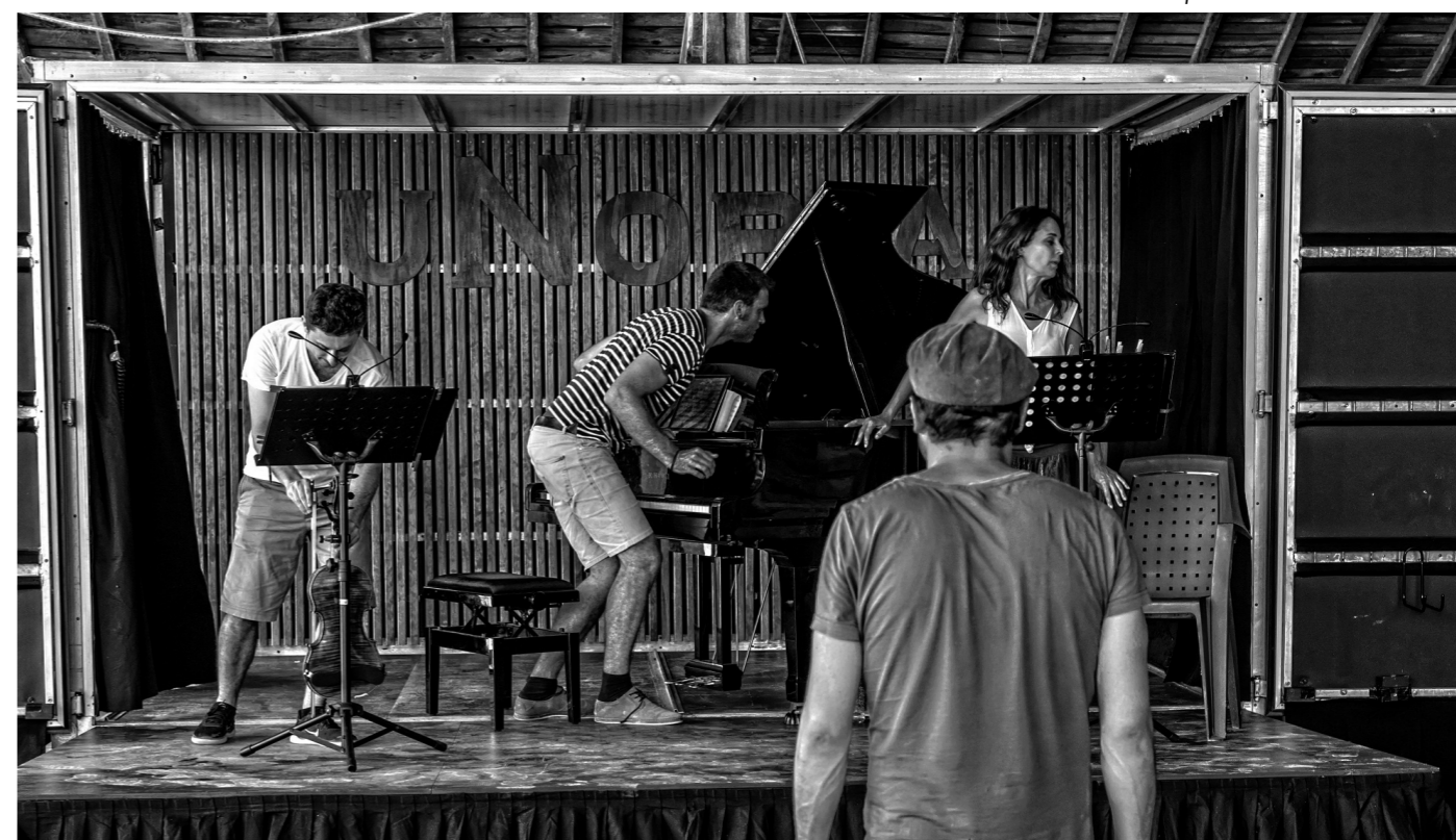
Les répétitions de Silence !