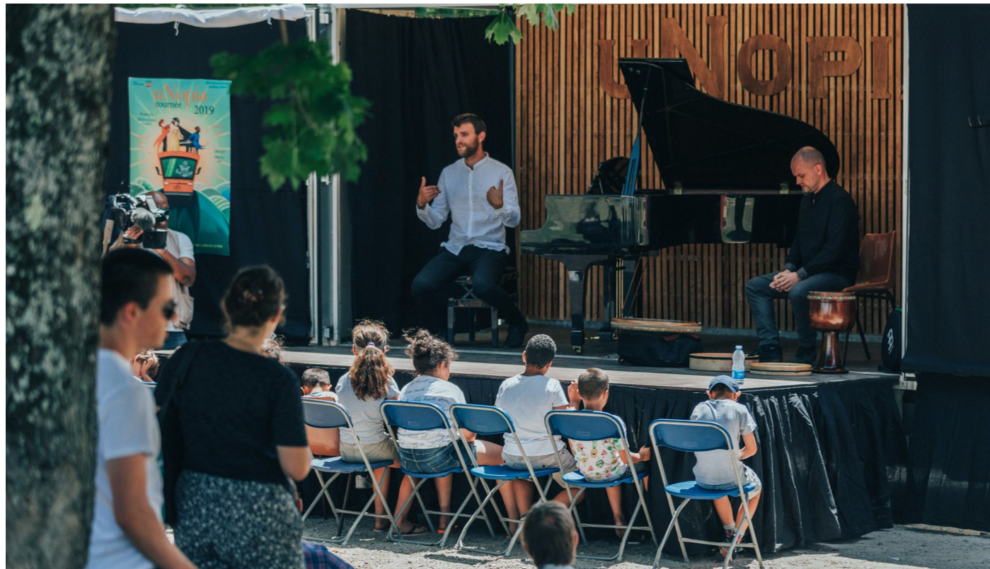
Concert à Limoges 17/07/2019